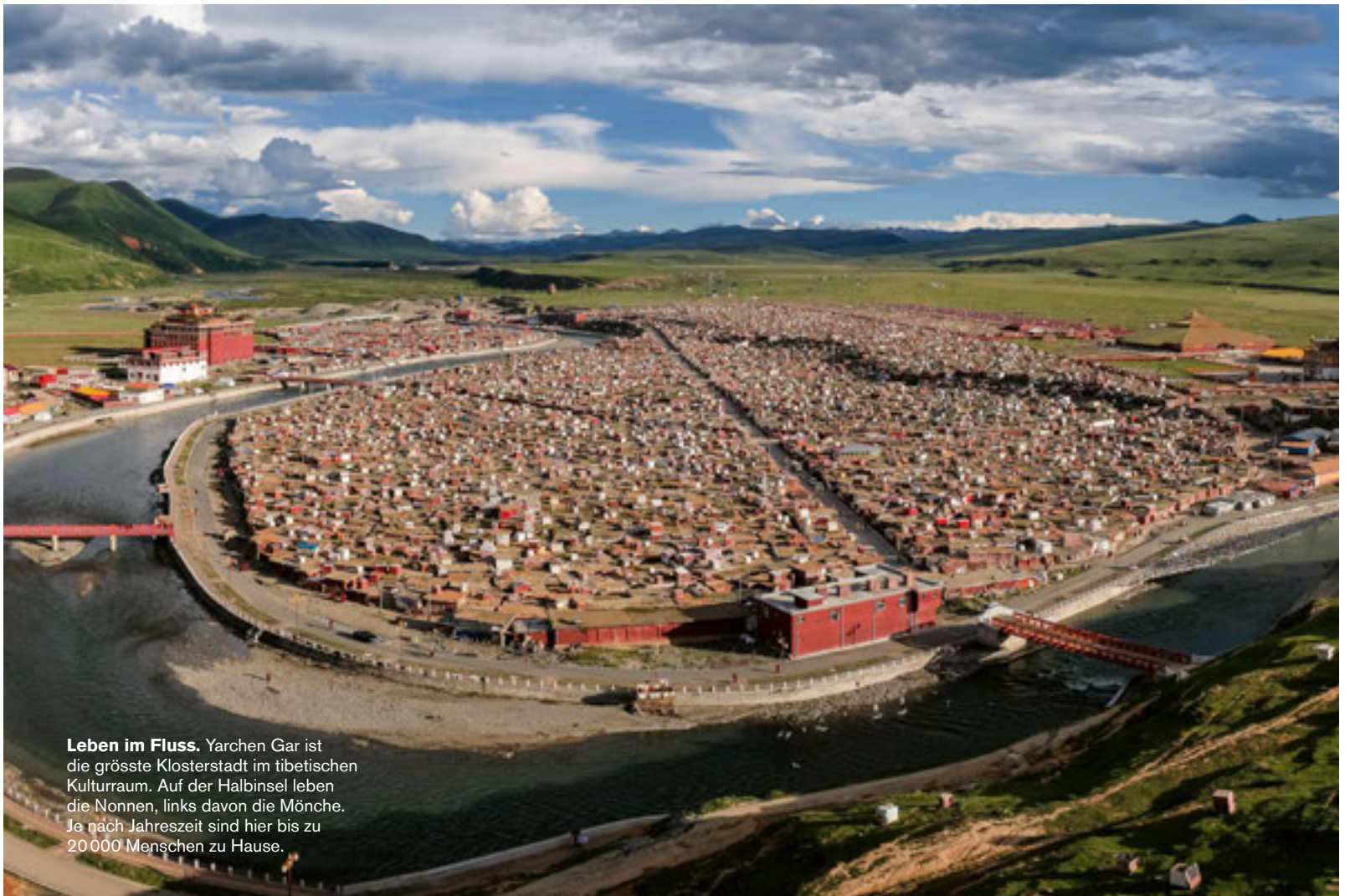
Leben im Fluss. Yarchen Gar ist die grösste Klosterstadt im tibetischen Kulturraum. Auf der Halbinsel leben die Nonnen, links davon die Mönche. Je nach Jahreszeit sind hier bis zu 20 000 Menschen zu Hause.