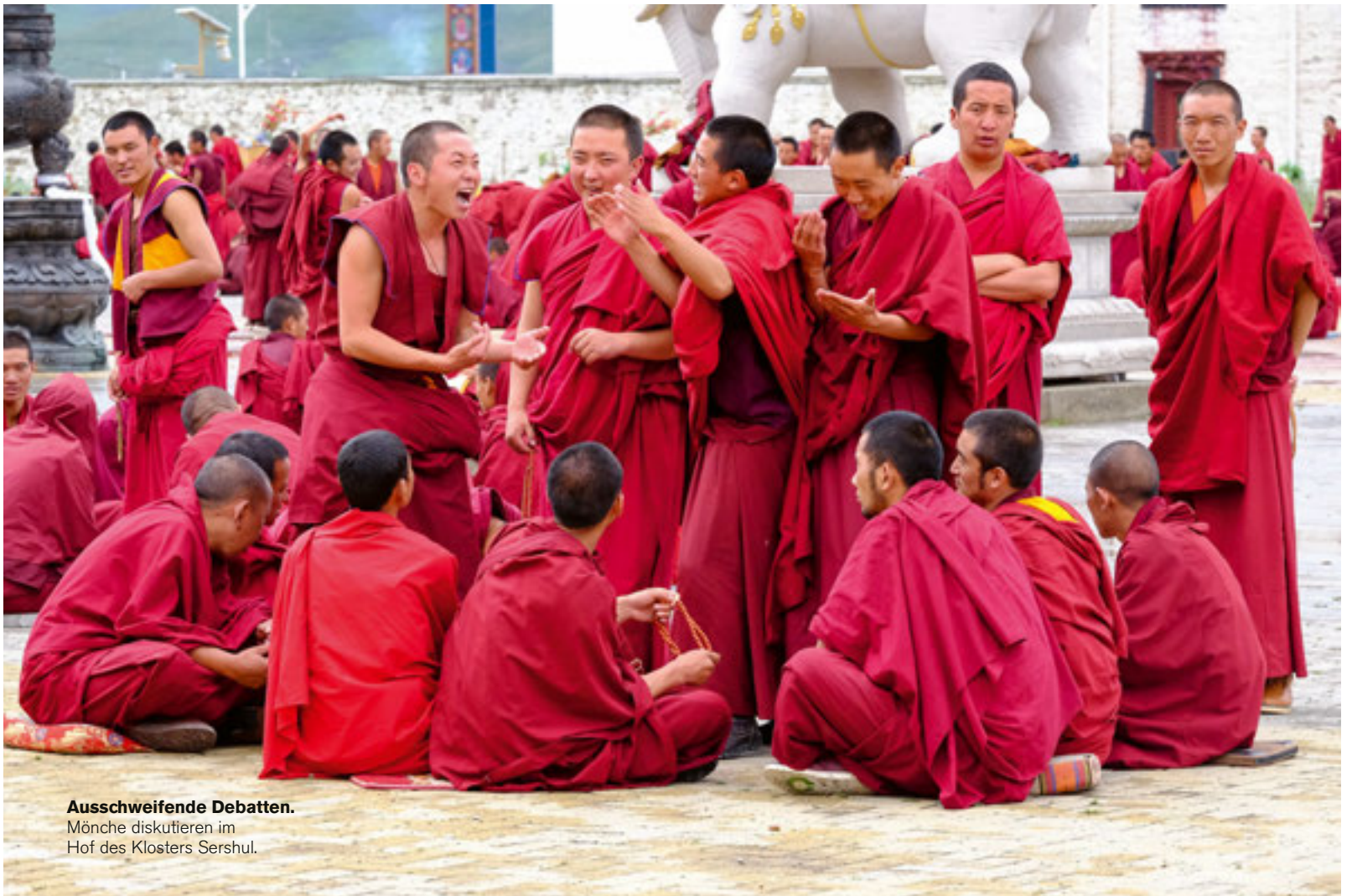
Ausschweifende Debatten. Mönche diskutieren im Hof des Klosters Sershul.